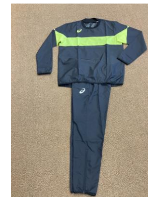
トップ(ロゴ入り)4,900円