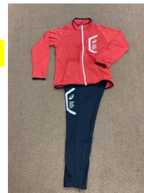
ジャケット(ロゴ入り)6,570円