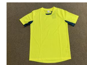
トレーニングシャツ (ロゴ入り)